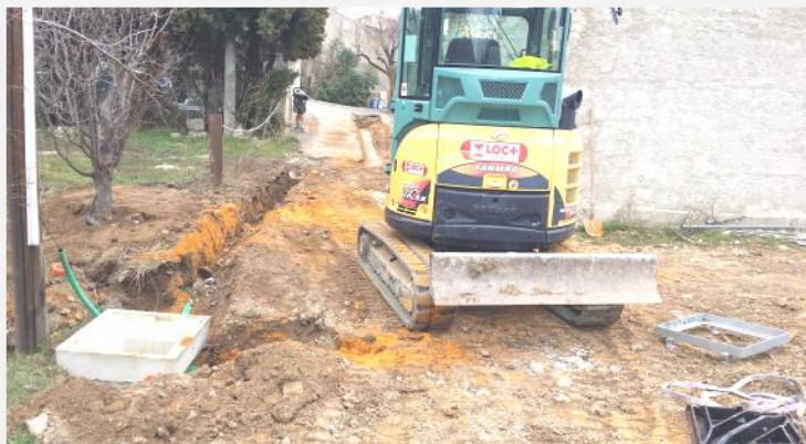
Le bas de la rue du Barry

La commune ne peut que se féliciter de ce projet et en profitera pour refaire le revêtement de la placette qui relie la rue du Pied d'août à la place Farinette.