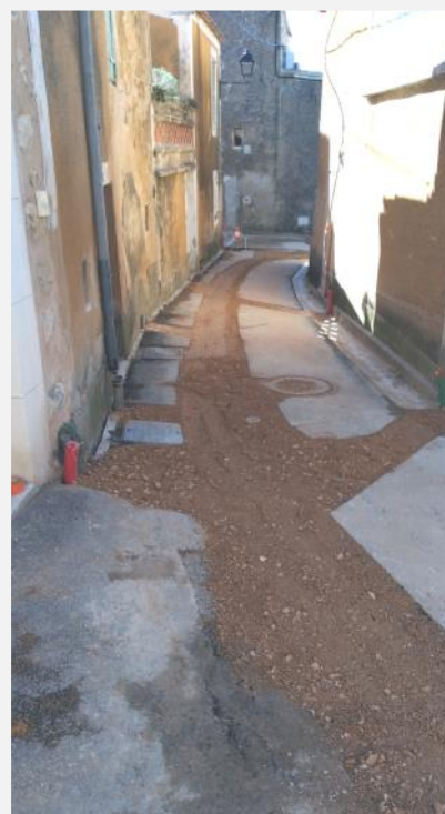
Rue du Pied d'Août